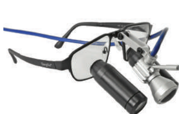
Смонтирован на TTL лупу