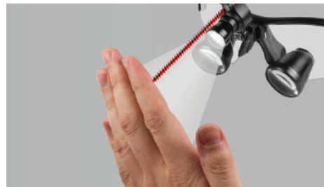
Включение / выключение от движения руки