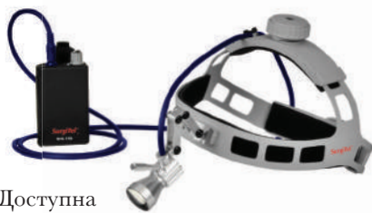
Доступна версия для FLM